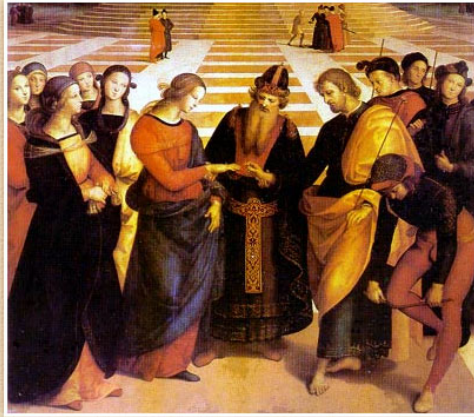
XXVII DOMENICA DEL TEMPO ORDINARIO Anno B